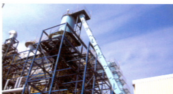
【設置例】高低差があるラインレイアウトでも対応が可能です。