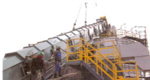
■1,000㎡サイロ投入コンベヤ設置の様子

強固なフレーム構造により、地上高の設置においてもフレーム形状をしっかりと保ちます。