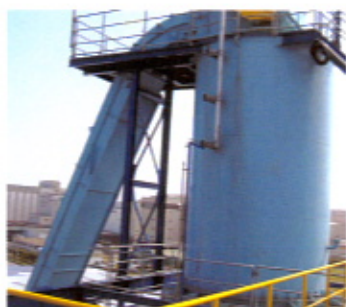
【設置例】密閉式なので多様な原料に対応できます。